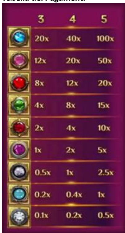
Tabella dei Pagamenti

Il Bonus Gemma bloccata paga in base alla tabella dei pagamenti.